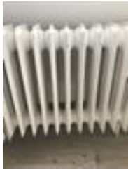
هزینه گرم کردن