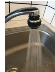
هزینه آب / فاضلاب

هزینه های دیگر به عنوان مثال برای سرایدار ، بیمه ساختمان ، برق عمومی