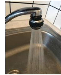
Su / atık su giderleri

Diğer masraflar mesela kapıcı, bina sigortası, elektrik (genel)